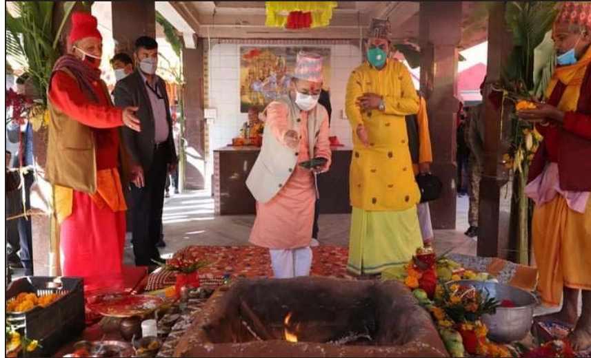
འགྲུབ་རྒྱུ་གཤམ་སྤུང་བ་གྲོ་སྤྱོད་ལྟེང་། འགྲུབ་རྒྱུ་གཤམ་སྤུང་བ་གྲོ་སྤྱོད་ལྟེང་།