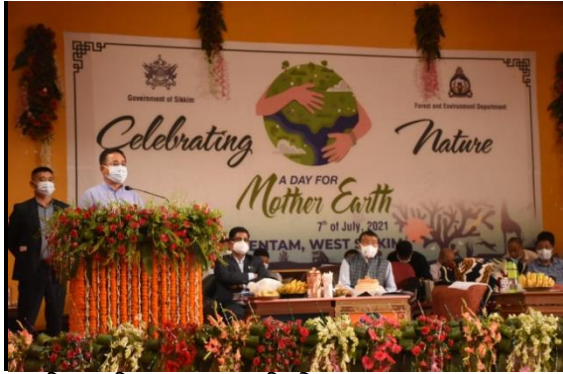
རྒྱལ་ཞིང་ དབྱེན་རྩེ་ བདུན་པོའི་ ཚེས་ ༧ཉིན་

གཙོ་སྤྱི་ རྫོང་པོ་ སྤྱི་ཞབས་ དེ་ཡི་སྤྱི་ ཉ་མང་གིས་ དབྱེན་གྱི་གནས་ ལུ་བ་ འབྲས་ལྗོངས་ཀྱི་ བདེན་གཏམ་ མཐོ་རིམ་ སློབ་གྲྭ་གྱི་ ས་གཞི་ འཛོམ་སྐྱིང་ ཡམ་མོའི་ཉེན་ ཡང་ན་ (A Day for Mother Earth ) བརྗེ་སྤྱང་ གནང་བོ་ ཡིན། ལེས་རིམ་འདི་ མཐོང་རྒྱལ་དང་ མཐའ་འཁོར་ ལེ་ལག་གིས་ གོ་སྐྱོགས་ རྒྱུ་ལས་པོ་ ཡིན། ལེས་རིམ་ན་ གཙོ་སྤྱི་ རྫོང་པོ་ མཉམ་པོ་ མཐོང་རྒྱལ་ ལེ་ལག་ རྫོང་པོ་, གཞན་ རྫོང་ཚུ་, མངའ་སྡེ་ གྲོས་ཚོགས་ སྐྱ་ཚབ་ ཁ་དཔོན་, དབྱེན་ གྲོས་ཚོགས་ ལྗོངས་འོ་ ལུ་མེ་དང་ གཞན་ གཞུང་གི་ འགོ་བྱེད་དང་ གཞུང་ཞབས་པོ་ཚུ་ རྫོང་པོ་ ཡིན། ཉེན་ དུས་རྫོང་འདི་ ལོ་ ༢༠༡༩ པའི་ དབྱེན་རྩེ་ བདུན་པོའི་ ཚེས་༧ ཉེན་ཚེ་ ལོ་རྒྱུ་ དཀར་མོ་ བདུན་ དོན་ལོ་ འཁོར་ལོ་ཚུ་ མ་བཏང་བ་ དགག་སྡེ་ བཞག་ཤད་ཀྱི་ འབྲམ་གཙུག་གོ་ ཡིན། གཙོ་སྤྱི་ རྫོང་པོ་གིས་ ལེས་རིམ་ དབྱེན་རྩེ་ བདུན་པོའི་ ཚེས་ བདུན་ཚེ་ སྤྱང་རྗེས་ བྱིས་མཉམ་ ས་གཞི་ འཛོམ་སྐྱིང་ ཡམ་མོའི་ ཉེན་གྱི་ ལྷབ་སྐྱོགས་ བྱིས་བཞེས་ རིང་གི་ ཀོ་བེཏ་ ༡༩ སྤྱི་ལོ་ལོ་ལོ་ བོད་སྤྱོད་ བྱིས་སྤྱི་ ལེས་རིམ་ གོ་སྐྱོགས་ རྒྱུ་ལས་པོ་ན་ དགའ་ཚུལ་ གནང་བོ་ ཡིན། གཙོ་སྤྱི་ རྫོང་པོ་གི་ མཐོང་རྒྱལ་དང་ མཐའ་འཁོར་ ལེ་ལག་གིས་ རང་འཐད་ རང་འཐད་ འཚར་གཞི་དང་ བོད་སྤྱོད་ བྱིས་ཡོད་པོའི་ ལོ་རིམ་ འཚར་གཞི་ རྟོང་ལས་ བྱིས་པོའི་ གོ་མ་པོ་ཚུའི་ དགའ་ཚུལ་ གནང་བོ་ ཡིན། འདི་ མ་རྗེས་པ་ མེས་པ་ བར་ན་ རིག་གོ་ སྤྱིང་ཤད་དང་ ཤིང་རྩ་ བརྗེན་ཤད་ལས་ ecosystemལོ་ ལོག་སྤྱི་རང་ སྤྱི་རྒྱུ་ལས་ བྱིས་ཤད་ འདི་ལས་ གཞན་ engineering measures ཞབས་ཤེས་ཚུ་ དང་ འཚོ་ཞབས་ གོ་སྐྱོགས་ཚུ་ ལག་ལེན་