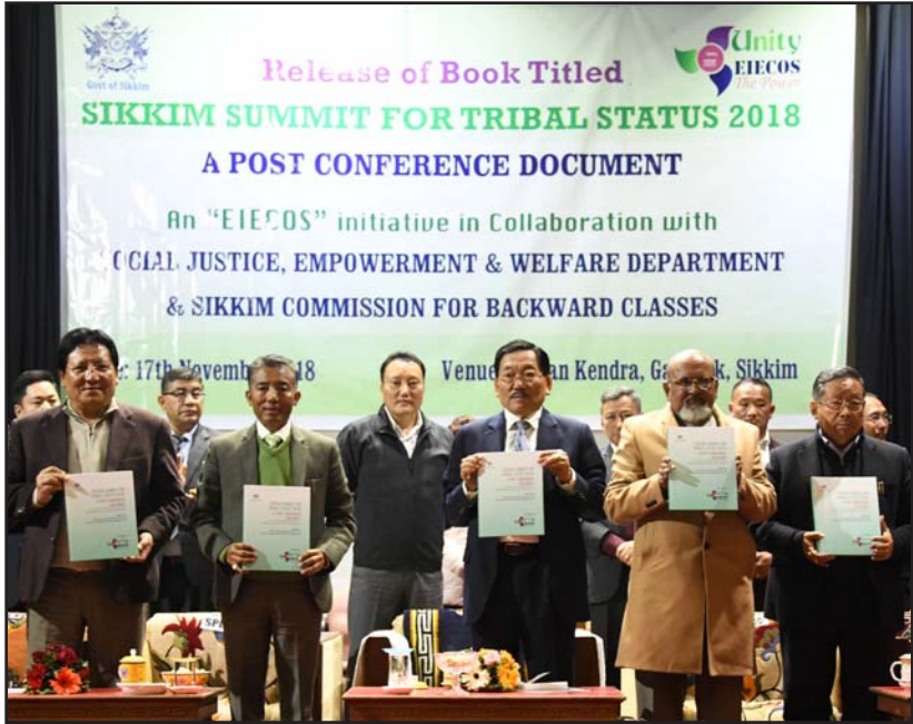
പുസ്തകം പുറത്തിറക്കിയിരിക്കുന്ന സമയത്ത്