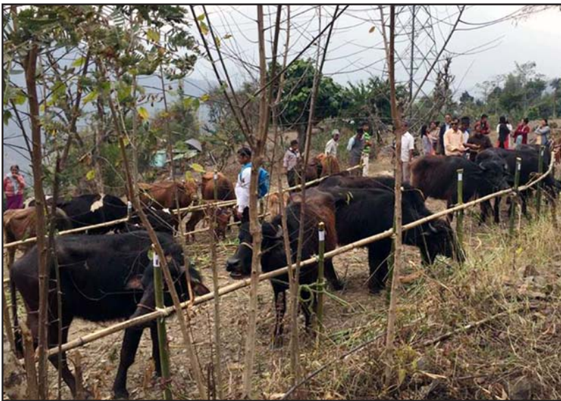
ལྷན་པོ་གྲོས་ཚོགས་ཀྱི་འཕྲིན་ལུགས་ལྷན་པོ་

ལྷན་པོ་གྲོས་ཚོགས་ཀྱི་འཕྲིན་ལུགས་ལྷན་པོ་ ལྷན་པོ་གྲོས་ཚོགས་ཀྱི་འཕྲིན་ལུགས་ལྷན་པོ་ ལྷན་པོ་གྲོས་ཚོགས་ཀྱི་འཕྲིན་ལུགས་ལྷན་པོ་ ལྷན་པོ་གྲོས་ཚོགས་ཀྱི་འཕྲིན་ལུགས་ལྷན་པོ་