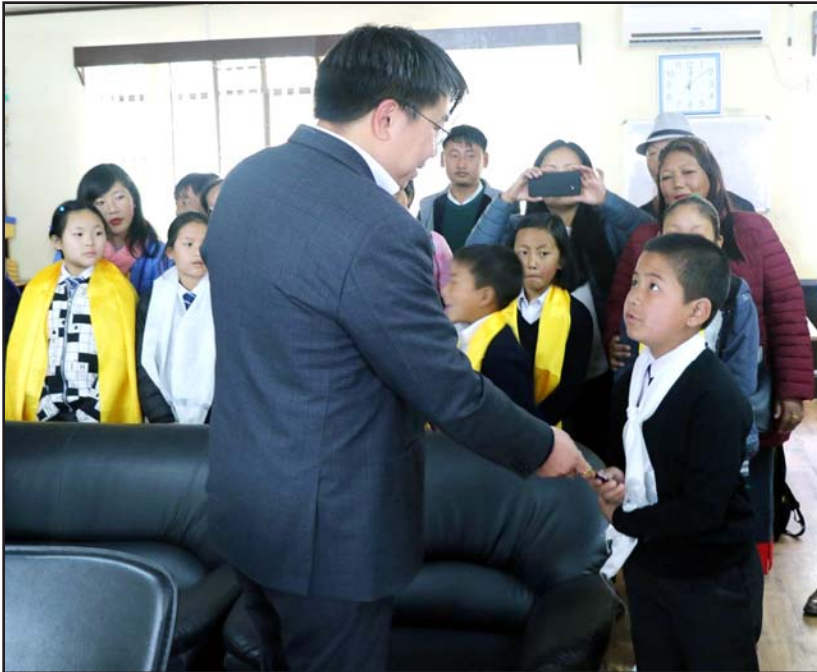
བཀའ་ལྷན་གྱི་ལྷན་པོ་གྲོས་ཚོགས་ཀྱི་འཕྲིན་ལུགས་ལྷན་པོ་

ལྷན་པོ་གྲོས་ཚོགས་ཀྱི་འཕྲིན་ལུགས་ལྷན་པོ་ ལྷན་པོ་གྲོས་ཚོགས་ཀྱི་འཕྲིན་ལུགས་ལྷན་པོ་ ལྷན་པོ་གྲོས་ཚོགས་ཀྱི་འཕྲིན་ལུགས་ལྷན་པོ་ ལྷན་པོ་གྲོས་ཚོགས་ཀྱི་འཕྲིན་ལུགས་ལྷན་པོ་